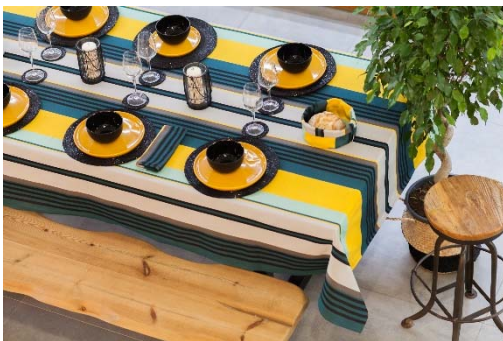
Nappe basque colorée

SIGNE OFFICIEL DE QUALITÉ ET D'ORIGINE, L'INDICATION GÉOGRAPHIQUE EST UNE GARANTIE D'AUTHENTICITÉ POUR LES CONSOMMATEURS ET UN MOYEN DE VALORISER LES SAVOIR-FAIRE ET LES PRODUITS DES ENTREPRISES.