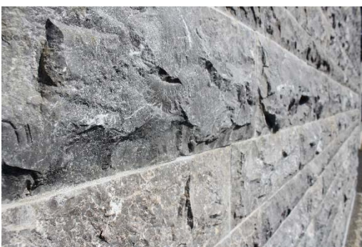
Mur en pierre d'Arudy

Douze indications géographiques sont désormais homologuées par l'INPI depuis l'entrée en vigueur du dispositif, après le siège de Liffol (décembre 2016), le granit de Bretagne (janvier 2017), la porcelaine de Limoges (décembre 2017), la pierre de Bourgogne (juin 2018), le grenat de Perpignan (novembre 2018), le tapis d'Aubusson (décembre 2018), la tapisserie d'Aubusson (décembre 2018), la charentaise de Charente-Périgord (mars 2019), les pierres marbrières de Rhône-Alpes (novembre 2019) et l'absolue Pays de Grasse (6 novembre 2020).