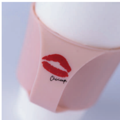
1-2 Reproduction déposée en couleur 1 091 416