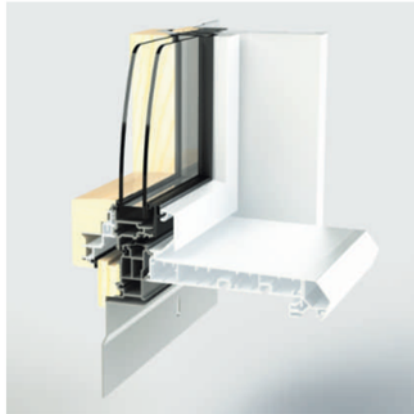
1-1 Reproduction déposée en couleur 1 061 809

Repr. 1-1 : La coupe de ce modèle de fenêtre est prévue pour être posé sur des constructions de bâtiments avec une isolation thermique extérieure