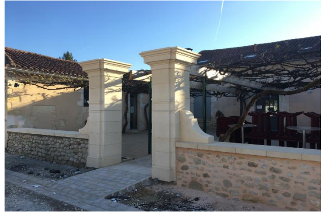
de gauche à droite : colonnes collège des Bernardins (Paris) en pierre de Mareuil ; colonnes en pierre de Paussac/Paussac St Vivien situées dans la commune de Montagnier (24)

Les deux nouvelles indications géographiques « pierre de Mareuil » et « pierre de Paussac/Paussac-et-Saint-Vivien » sont portées par l'Association Pierres Naturelles Nouvelle-Aquitaine, son organisme de défense et de gestion.