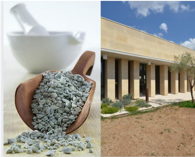
A gauche : argile concassée A droite : centre formation Marguerites (83)

SIGNE OFFICIEL DE QUALITÉ ET D'ORIGINE, L'INDICATION GÉOGRAPHIQUE EST UNE GARANTIE D'AUTHENTICITÉ POUR LES CONSOMMATEURS ET UN MOYEN DE VALORISER LES SAVOIR-FAIRE ET LES PRODUITS DES ENTREPRISES.