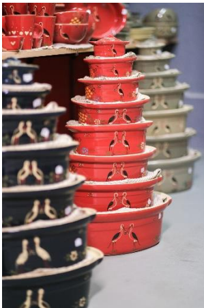
Piles de terrines Entreprise Siegfried – Burger & fils

SIGNE OFFICIEL DE QUALITÉ ET D'ORIGINE, L'INDICATION GÉOGRAPHIQUE EST UNE GARANTIE D'AUTHENTICITÉ POUR LES CONSOMMATEURS ET UN MOYEN DE VALORISER LES SAVOIR-FAIRE ET LES PRODUITS DES ENTREPRISES.