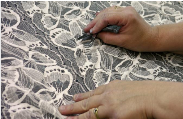
La « visiteuse » inspecte la dentelle de Calais-Caudry

SIGNE OFFICIEL DE QUALITÉ ET D'ORIGINE, L'INDICATION GÉOGRAPHIQUE EST UNE GARANTIE D'AUTHENTICITÉ POUR LES CONSOMMATEURS ET UN MOYEN DE VALORISER LES SAVOIR-FAIRE ET LES PRODUITS DES ENTREPRISES.